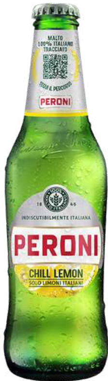
PERONI CHILL LEMON Birra Peroni S.r.l.