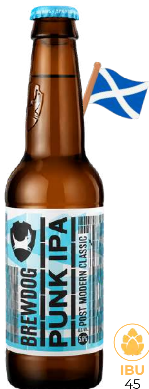
BREWDOG PUNK IPA Brewdog Birra