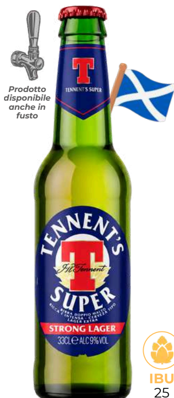
TENNENT'S SUPER Ab-Inbev Spa