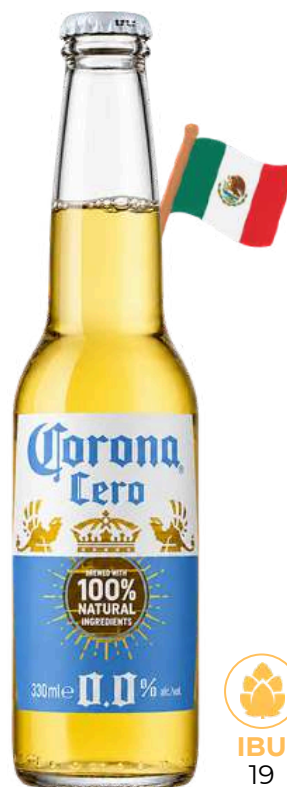
CORONA CERO Ab-Inbev Spa

DESCRIZIONE Birra Analcolica prodotta con ingredienti 100% naturali. TIPOLOGIA Lager COLORE Giallo dorato chiaro GRADAZIONE 0% FORMATO cl 33 vap BICCHIERE direttamente dalla bottiglia TEMP. DI SERVIZIO 4/6 gradi COME VERSARE va consumata in bottiglia con fettina di lime. SAPORE Leggermente luppolato, lievemente amaro ABBINAMENTI Ideale come aperitivo, si accompagna con tutto e in particolare con stuzzichini salati, piatti delicati, verdure grigliate, pesce, carni bianche, insalate e pizze semplici. FERMENTAZIONE bassa