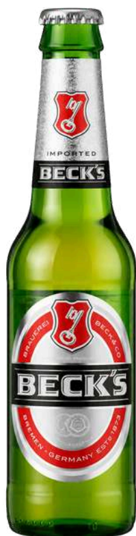
BECK'S Ab-Inbev Spa