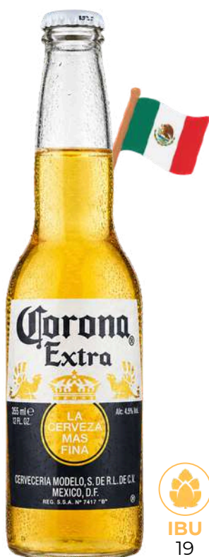
CORONA EXTRA Ab-Inbev Spa

DESCRIZIONE Per la caratteristica schiuma sottile va consumata direttamente in bottiglia con fetta di limone nel collo della bottiglia e sale imboccatura bottiglia TIPOLOGIA Lager COLORE Giallo torbido GRADAZIONE 4,6% FORMATO cl 33 vap BICCHIERE direttamente dalla bottiglia TEMP. DI SERVIZIO 4/6 gradi COME VERSARE va consumata in bottiglia con fettina di limone SAPORE luppolato ABBINAMENTI burritos tortillas tacos FERMENTAZIONE bassa